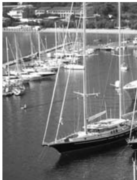
Der hübsche, kleine Hafen von Calvi, der für vier Tage lang Treffpunkt für ein „rauschendes“ Fest der Jongert-Familie war

Nach der „Registrierung“ traf man sich Donnerstag Nachmittag auf der