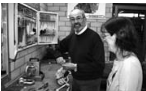
Also, da freut sich ja offensichtlich die gesamte Werftmannschaft über ihre gelungenen Arbeiten.