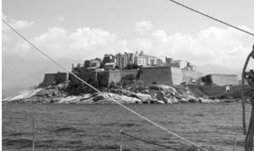
Die Zidatelle, der ehemalige Gouverneurspalast und Wahrzeichen von Calvi, beherbergt noch heute die letzte Abteilung der Fremdenlegion auf der Insel.

langen Vorwindschlag ein Spinnaker auf der Strecke, der Wind hatte inzwischen auf über 7 Beaufort zugelegt. Ansonsten verlief dieser erste Regattatag zum Glück ohne weitere Blessuren, und bei bester Laune aller Teilnehmer. Abends wurde die ganze Bagage mit einem Bus in ein außerhalb gelegenes Restaurant kutschiert, ein entzückendes Landhaus und eigens für uns reserviert. Korsische Musik mit Gitarren, Geigen und Gesang, von drei jungen Burschen vortragen, begleitete ein im Innenhof unter freiem Himmel aufgebautes, riesiges, bunt gemischtes korsisches Vorspeisen-Buffett neben allen nur erdenklichen Getränken. Zwischen all der Promis sah man auch Segel-Starfotograf Franco Pace mit seinem Assistenten, extra für diesen Event angeheuert. Anschließend gab's im Restaurant Lammkeule nach Art der Hirten bei jazziger Klaviermusik und Gesang... dazu fiel einem wirklich nichts mehr ein. Rund 150 Personen waren schlichtweg begeistert. Alle waren von Jongert eingeladen. Der Busfahrer hatte zur vorgerückten Stunde so auch seine liebe Not, die inzwischen zur Höchstform aufgelaufenen Segler, wieder in seinen Bus und nach Calvi zu befördern.