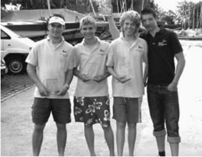
Doppelerfolg für die jungen WYC-Teilnehmer in Radolfzell.

lagen wir am ersten Tag mit 4 Punkten Vorsprung auf Dennis und Kevin in Führung.