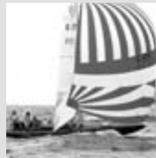
Neubauten "EXCALIBUR" erster formverleimter 30'er

Yachten Boote Neubauten Renovierungen Umbauten Überholung Winterlager Service Michelsen, traditionell und modern in Holz seit 1921