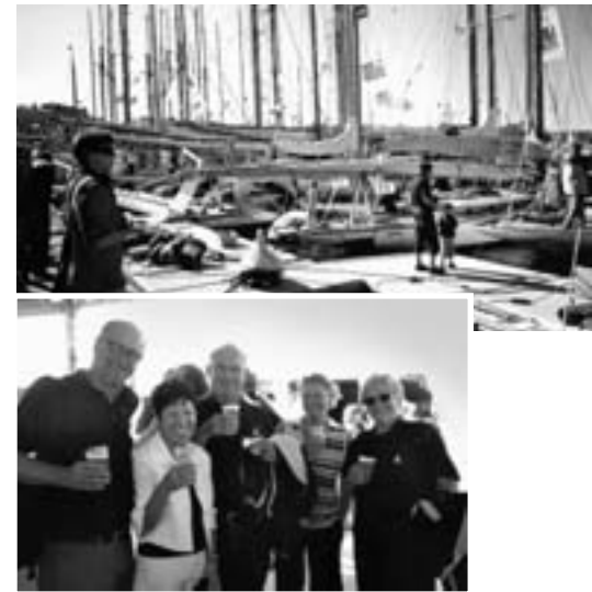
Wo treffen sich vom Bodenseesegler im Herbst? Na ist doch klar, in St. Tropez zur „Voiles“:

die malerisch gelegene Küstenstadt am gleichnamigen Golf im Mittelmeer. Seit den achtzigern wird dort eine wahrlich rauschende Regattawoche gesegelt und natürlich gefei-