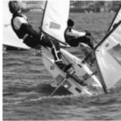
Optimale Bedingungen zur Interboot Trophy direkt vor der Uferstraße von Friedrichshafen.

doch den 3. Gesamtplatz von letztem Jahr nicht verteidigen.