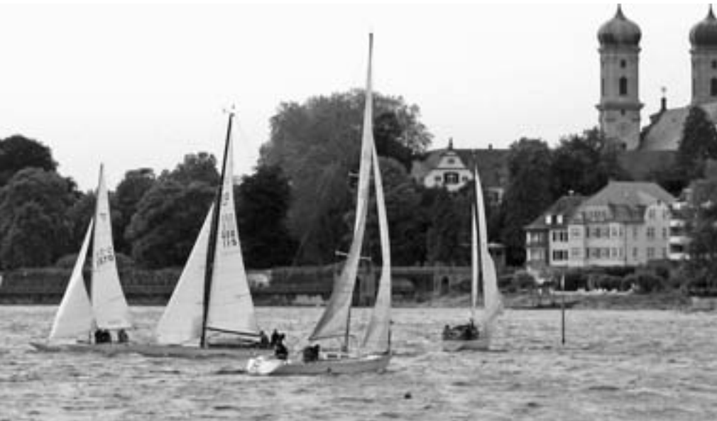
Die Mittwochsregatta gehört seit Jahren zum festen Bestandteil der Regatten des WYC.

Rund 300 Schiffe in 64 verschiedenen Klassen und über 2100 Aktive nahmen an insgesamt 18 Regatten, davon zwei Langstrecken, teil. Zur