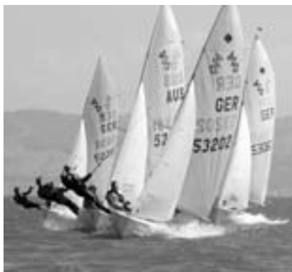
Bei fantastischen Bedingungen wurde während der Deutschen Jugendmeisterschaft im 420er um den Titel gekämpft.

fühlten sich auf unserem Gelände in Seemoos zehn Tage lang offensichtlich sehr wohl. Bei besten Windverhältnissen konnte Wettfahrtleiter Markus Finckh absolut meisterschaftswürdige Regatten durchführen. Allen Helfern, Verantwortlichen und natürlich auch unseren Sponsoren ein herzliches Dankeschön. Für die technische Vorbereitung des Ge-