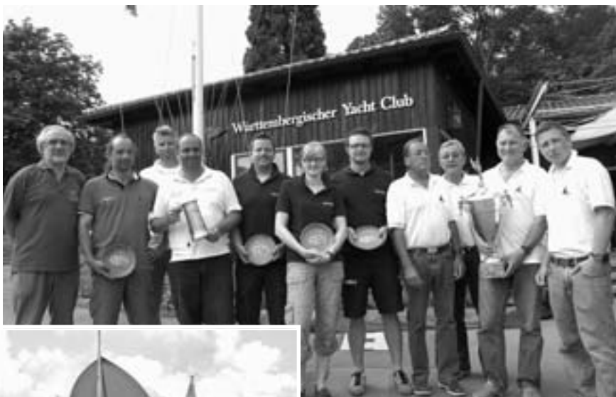
Glückliche Gesichter bei den Siegern der Pokal-Regatta und der Wettfahrt-Crew.