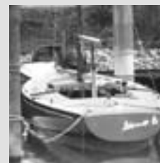
Neubauten Vollausstattung, Trias