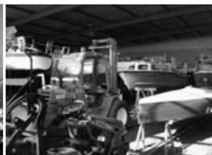
Die ruhige Zeit vor der Winterpause. Alle Boote sind versorgt.