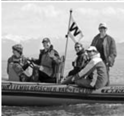
Da staunt selbst die Wettfahrtsleitung, bei soviel sportlichem segeln.