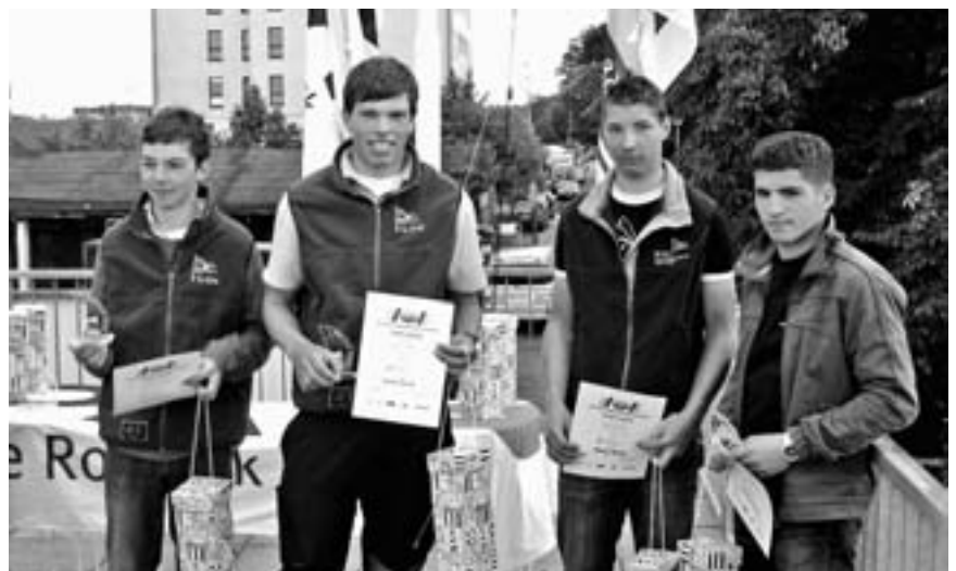
Glückliche Gesichter der Bodenseesegler nach der EM & WM Ausscheidung in Warnemünde.

Der Wetterbericht sagte fürs Wochenende Ostwind der Stärke drei bis fünf voraus. Dies bedeutet in Warnemünde ganz schön große Wellen. Beim Training hatten wir jeden Tag ablandigen Südwind mit kleiner Welle. So wussten wir nicht genau, was uns beim Ostwind erwartet. Die erste Regatta am Samstag um 12.00 Uhr begann nach einer Startverschiebung mit leichteren östlichen, etwas drehenden Winden. Nach einem missglückten Start hatten wir