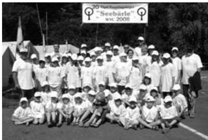
40 junge und erwartungsfrohe Kinder freuen sich auf die Lagertage.