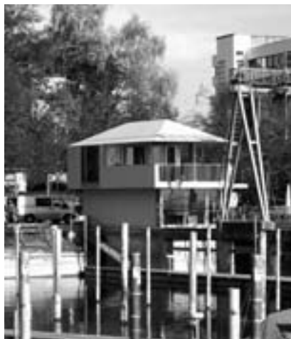
Nun ist das neue Hafenhause bezogen und wartet auf die kommende Saison.

So unauffällig, flott und von der Öffentlichkeit fast unbemerkt unser Clubhauseanbau vonstatten ging, so