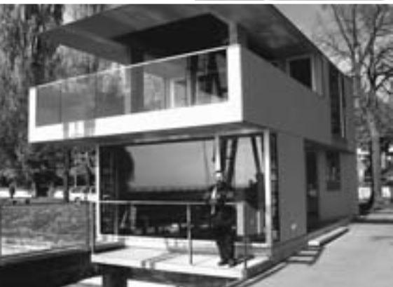
Als Schmuckstück passt sich das neue Hafenhäus in die Optik der Uferstraße ein.

muss, sich in einen ungeeigneten Platz hinein zu zwängen. Unsere Gäste haben diese Maßnahme sehr begrüßt. Auch der Hafenmeister hat es leichter, wenn er mit einer aktuellen Liste unsere Gäste gleich in den „passenden“ Platz einweisen kann.