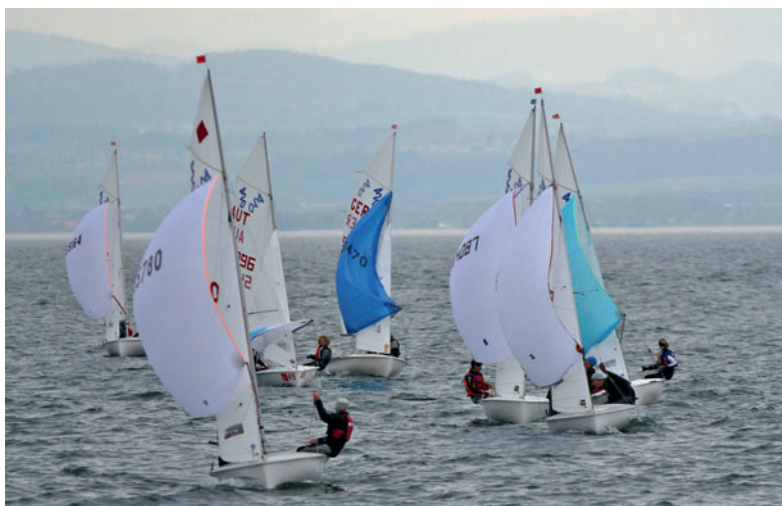
Die 420er bei der „Claude-Dornier-Regatta“ des WYC.

Auch am Sonntag standen Segler wie Wettfahrtleitung schon um neun Uhr wieder am Ufer – und guckten sich die Augen vergebens nach regattatauglichem Wind aus. Die Kuchenstücke in den Verpflegungsbuden in Seemoos wurden rasant weniger und der Grill wurde angeheizt. Doch weder das eine noch das andere reizte den Wind