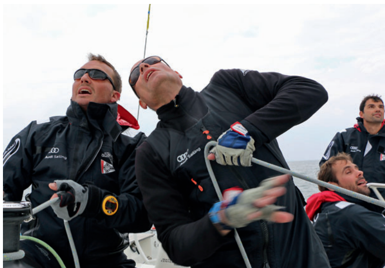
Action im Cockpit bei der Halse.

Schon in der Vorrunde hatte das Team Ellegast für Aufsehen gesorgt: Mit sechs Siegen aus elf Rennen waren sie völlig überraschend auf dem dritten Platz gelandet. Die Zwischenstände waren ein Wechselbad der Gefühle. Mal lief es gut, dann wieder weniger – und am Abend des zweiten Tages waren nur drei Punkte auf der Haben-Seite