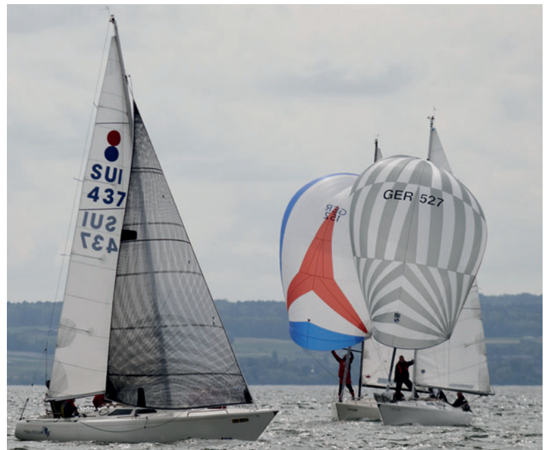
Dynamic 35 bei der „Pokalregatta“, unten die „Dreißiger“ unter Spinnaker.

Nachdem die vorgesehene vierte Wettfahrt dem unbeständigen Leichtwind am Sonntag zum Opfer fiel, war auch bei dieser Regatta der Zwischenstand vom Samstagabend schon das Endergebnis.