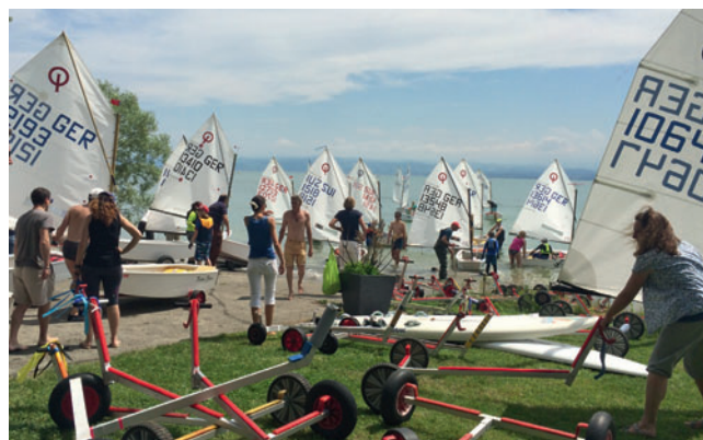
Tatkräftig beim Opti-Training: Die WYC-Eltern.

Auch an Ostern wurden nicht nur Eier gesucht, sondern feste trainiert! Die 420er waren in Izola (Slowenien), die Laser am Gardasee bzw. Comersee und die Optis im heimischen Seemoos zum Saison-Auftaktraining. Alle haben einiges an Erfahrung und Können gesammelt.