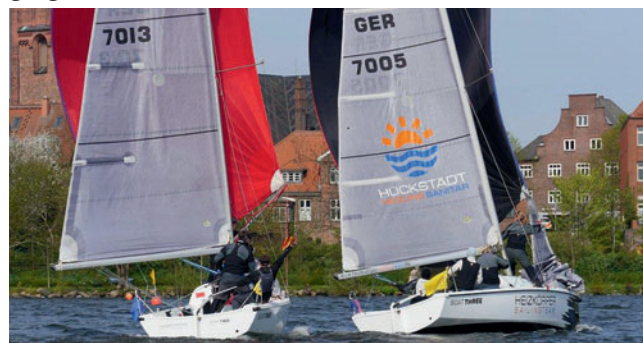
„Team up!“ (links) kann dem Gegner einen Penalty aufhängen und holt sich Platz drei beim Match-Race in Plön.