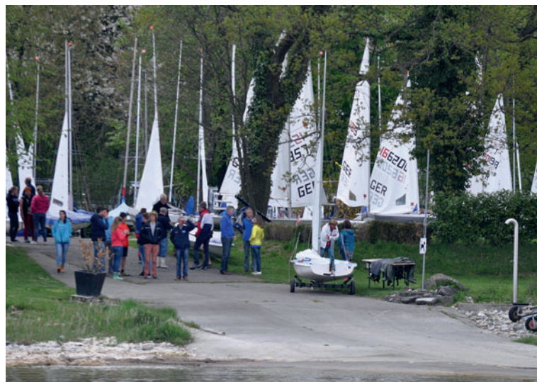
Warten auf Wind in Seemoos bei der Claude-Dornier-Regatta.

(Segler und andere dafür umso mehr). „Kein Lüftchen weht“, musste Regattaobmann Wolfgang Hund feststellen. Und so blieb es bis 13.30 Uhr, als die Startbereitschaft aufgehoben wurde. Für die Preisverteilung nach der einen gewerteten Wettfahrt vom Vorabend musste dafür nicht eigens gerechnet werden.