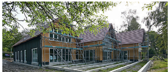
Das neue Clubhaus in Seemoos ist fast fertig!

Süden in den saronischen Golf und in die westlichen Kykladen. Inzwischen ist Meltemi-Zeit, was wir deutlich zu spüren bekommen.