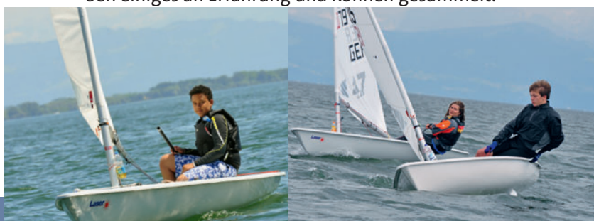
Laser-Nachwuchs vor Seemoos: Auch wenn die Erdkrümmung am Bodensee 67 Meter ausmacht – dieser Knick vor Seemoos existiert nicht wirklich.