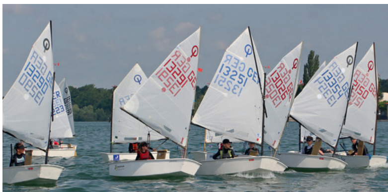
Leichter Wind und Sonne, nachts Gewitter: 65 Nachwuchssegler segelten beim WYC um den „Seemooser Opti-Pokal“.

ganz junge Opti-Segler haben. Die Routine kommt schon noch“, war Regatta-Obmann Wolfgang Hund zufrieden. Trotz ungünstiger Wettervorhersage gab es keine Probleme mit dem Wind. „Wir sind glücklich, dass wir alle Wettfahrten durchbekommen haben“, sagte Wettfahrtleiter Conrad Rebholz. Denn bei westlichen Winden mit rund zwei Windstärken am Samstagnachmittag wurden in beiden Gruppen – auf separaten Bahnen – gleich vier Wettfahrten nacheinander