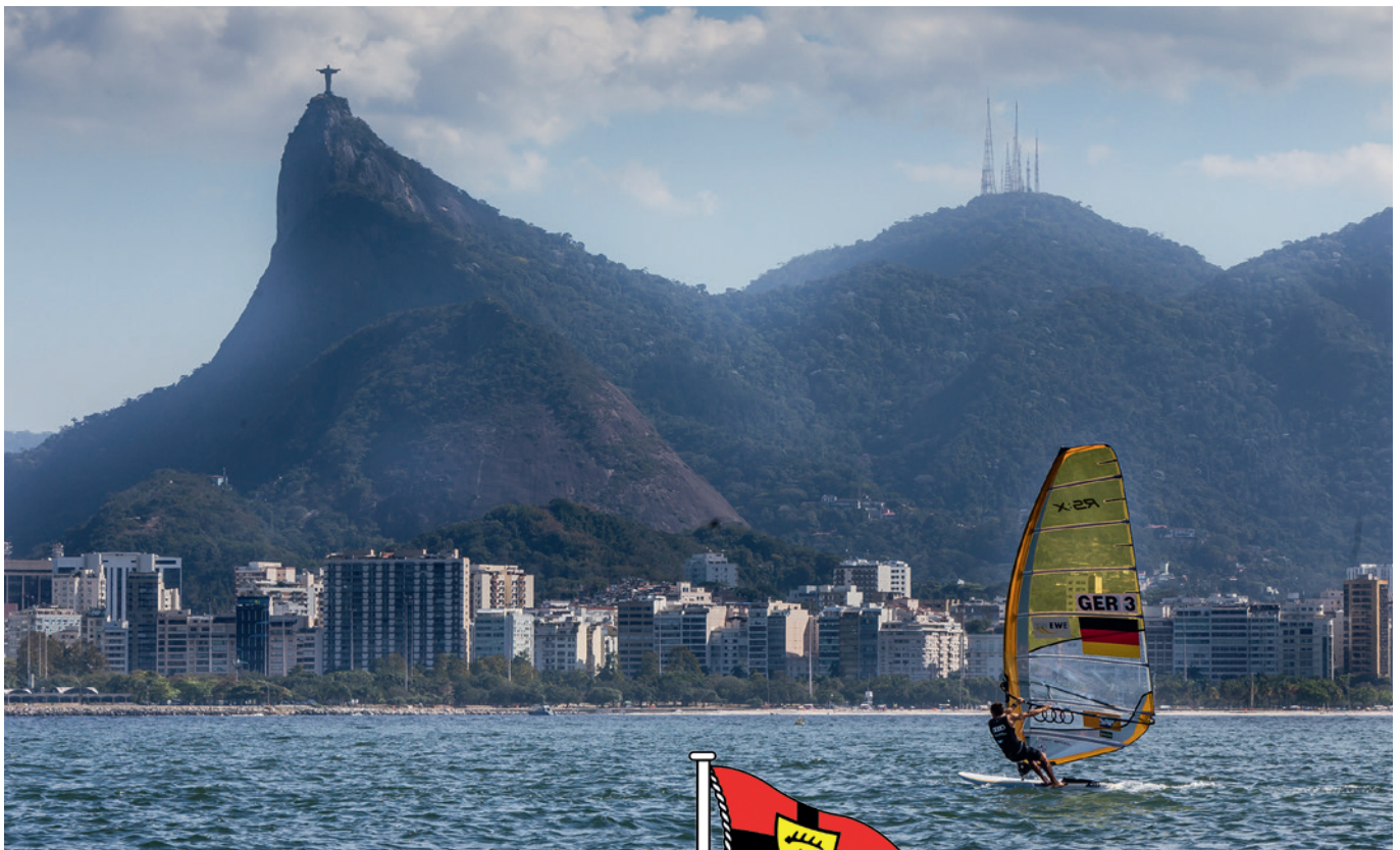
Ab dem 8. August surft Toni Wilhelm unter dem Zuckerhut.