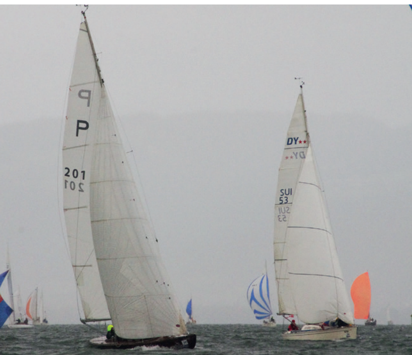
Ein bisschen regnerisch war es bei der Rundum. Der SCHUFT P201 brauchte knapp 16 Stunden bis ins Ziel – und gewann in der Gruppe der 45er Kreuzer.