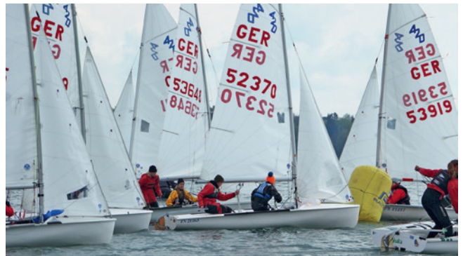
Claude-Dornier-Regatta 2016: Bei den 23 Booten in der 420er-Klasse wurde es an den Wendemarken etwas eng.

Über 90 Teilnehmer – hier die 420er mit Spinnaker auf Vorwindkurs, dazwischen zwei Laser – (und das Team der Wettfahrtleitung) trotzten dem kalten Wetter Ende April und segelten vier bzw. fünf Wettfahrten bei der „Claude-Dornier-Regatta“ des Württembergischen Yacht-Clubs.