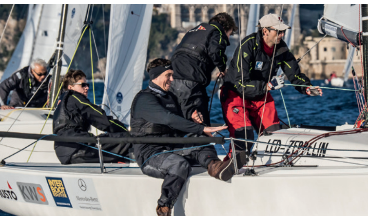
Es ging oft richtig zur Sache in Monaco.

18 Segler, vier Regattaserien, zwei Boote – und viel Erfahrung, so die Bilanz des Württembergischen Yacht-Clubs nach der Winterserie der J70-Yachten in Monaco. Jeden Monat fand dort eine dreitägige Regatta für diesen Bootstyp statt, der auch in der deutschen Bundesliga gesegelt wird. Seit Dezember war der WYC mit von der Partie, meist mit zwei Booten.