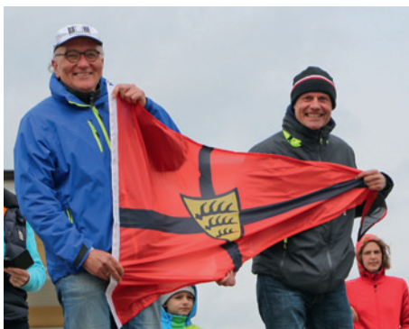
Die Fans zeigen Flagge!

Spannende Wettfahrten erlebten Tausende von Zuschauern in den Uferanlagen von Langenargen, darunter auch eine kleine Fan-Delegation des WYC. Das erste Rennen gewann Jablonski souverän. Dramatisch war der zweite Lauf. Schon in einer extrem