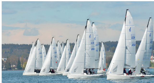
27 Boote segelten beim Auftakt der 2016er Battles in Lindau. Die MOTHERSHIP GER 715 hat den Bug schon vorne.