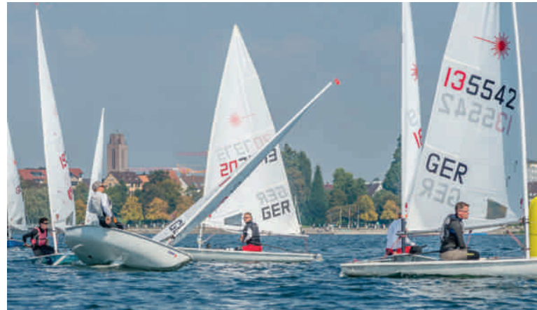
Die Laser bei der Interboot-Trophy des WYC.

Bei der Interboot-Trophy des WYC waren Ende September 57 Einhandsegler in den Klassen Laser-Standard, Laser-Radial (unten links), Contender (unten rechts) und 12-Fuß-Dinghy (rechts) am Start.