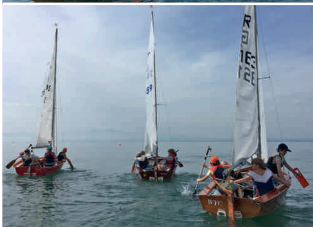
Tolle Atmosphäre beim Schnuppersegeln Ende August im WYC.

zulernen. Der WYC bedankt sich für die rege Teilnahme und freut sich, die ein oder anderen Schnupperseglerinnen und -segler im WYC begrüßen zu dürfen.