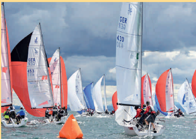
Welle, Wind und Wolken Anfang Juli bei der vierten J70-Battle in Kreuzlingen.