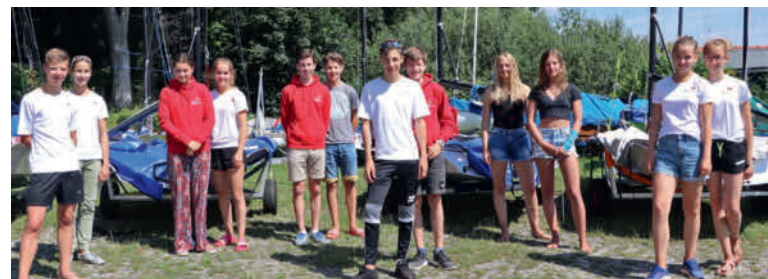
Mit sechs Teams war der WYC am Ammersee - doch der Wind war nicht dabei.

Gleich elf WYC-Jugendliche waren Mitte Juli an den Ammersee gefahren, um vor Utting beim neu terminierten „29er-Cup“ zu segeln. 21 Teams warteten aber zwei Tage lang umsonst auf Wind.