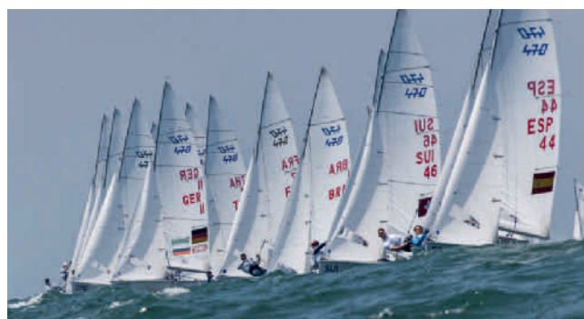
Die Terminplanung der 470er stochert 2020 in unbekanntem Gewässern.