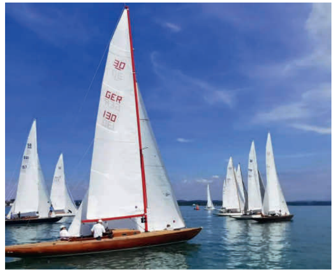
Elf 30 qm Schärenkreuzer waren bei der „Pokalregatta“ des Württembergischen Yacht-Clubs am Start (unser Foto), dazu elf 45 qm Nationale Kreuzer und Dynamic 35. Mangels Wind kam in allen drei Klassen nur eine Wettfahrt zustande.