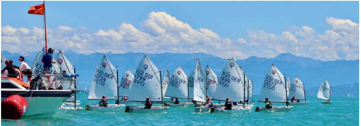
60 Nachwuchsegler waren mit ihren Optimist-Dinghies beim Württembergischen Yacht-Club und segelten bei Sonne und Wind auf türkisfarbenem Wasser um den „Seemooser Opti-Pokal“. Unser Bild zeigt den Start der Gruppe B.