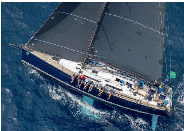
Die MUSIC auf dem Weg zum Giraglia-Felsen vor Korsika.