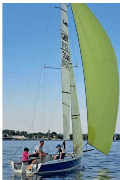
Der Laser SB3 des WYC.

den Angeboten der anderen WYC-Ressorts für Fahrtensegler ab. Sind zwei „Abonnenten“ auf einem der Kielboote, können sie ohne weiteres auch mal Freunde mitnehmen. Eine Einweisung gibt es vorab.