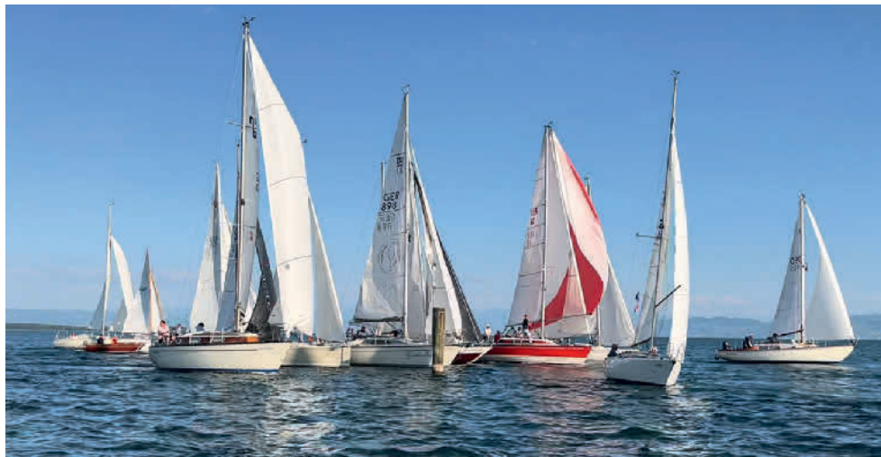
39 Boote waren bei der Langstrecke im Rahmen der Mittwochsregatten am 14. Juni am Start. An der ersten Bahnmarke, dem 39er Pfahl, wurde es da schon mal eng.

Auch die vorausgehenden Wettfahrten im Rahmen der Mittwochsregatten in Friedrichshafen waren vom Wetter verwöhnt. „Wind und Sonne – was will man mehr?“, fragte Michael Lange grinsend. „Teilweise wurden von vielen Teilnehmern die fünf Runden geknackt, einmal waren es sogar sechs Runden“, resümiert er nach einem Drittel der Termine 2023. Seit zehn Jahren gehört Lange zum Orga-Team der Mittwochsregatten, „aber das hatten wir noch nie“!