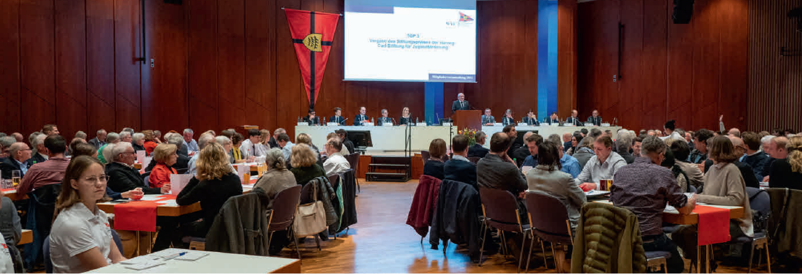
Nach drei Corona-Jahren konnte die Mitgliederversammlung des WYC 2023 wieder zum üblichen Termin Mitte März durchgeführt werden.