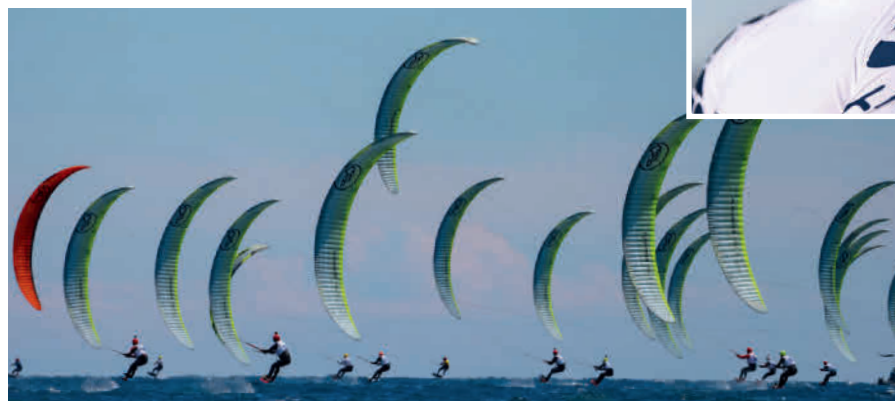
Mit der Weltspitze surfte Jan Vöster beim Warm-up vor der WM in Hyères. Die Kite-Surfer geben da immer ein faszinierendes Bild ab.