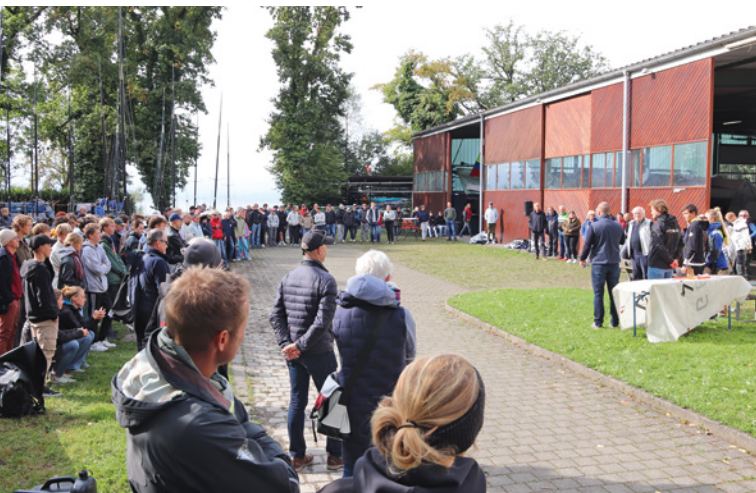
„Volles Haus“ bei der IDJM in Seemoos

in der ersten Hälfte der IDJM spielte der Wind mit: Rund vier Windstärken am Donnerstag ermöglichten gleich zum Auftakt vier Wettfahrten. Die späteren Sieger setzten sich schon einmal an der Tabellenspitze fest. „Wir hatten einige Kenterungen, aber das war alles unproblematisch. Die 29er kentern schnell und oft, die jungen Segler beherrschen auch das Wiederaufstellen“, so Stahl. Auch am Freitag wehte wieder nordöstlicher Wind, allerdings war er leichter, begleitet von etwas Regen. Weitere fünf Wettfahrten wurden gesegelt. Damit war es dann