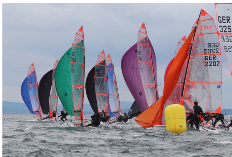
29er unter Gennaker bei der IDJM auf dem Bodensee.