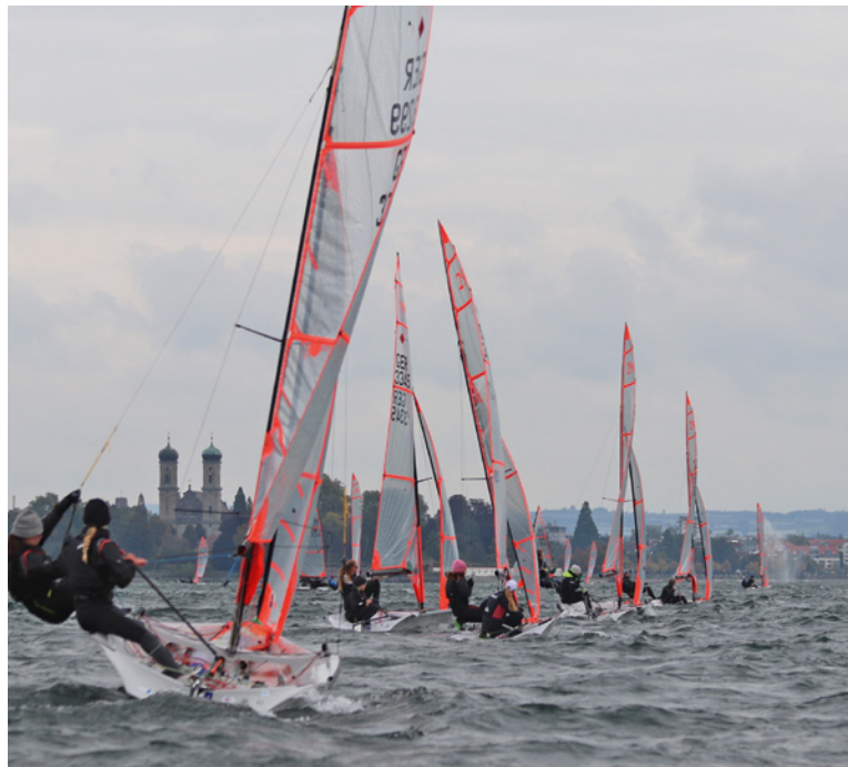
Auch der Wind spielte mit bei der Jugendmeisterschaft.