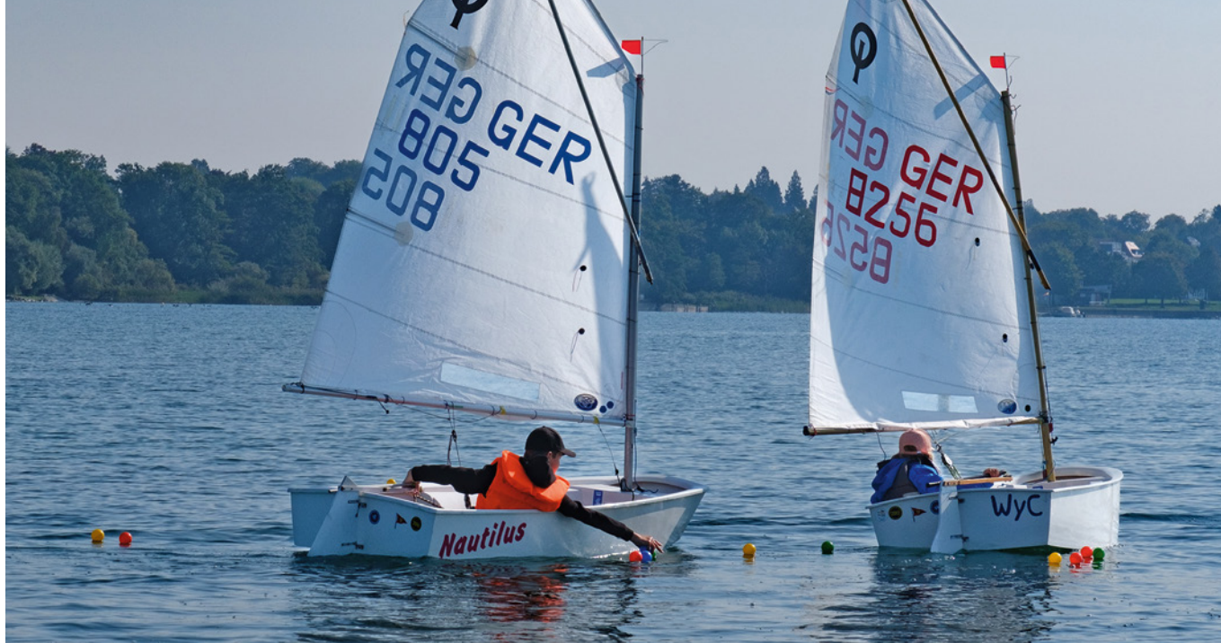
Bälle einsammeln auf dem Wasser war der Renner beim Segeln für Kinder mit Handicap, das der WYC im September in Seemoos veranstaltete.

davon eines im Rollstuhl, welches über eine eigens angelegte Gangway an Bord kommen konnte. Wir freuten uns über die Begeisterung unserer kleinen Segler. Auch wenn der Tag erfolgreich war und alle mit einem Lächeln von Bord gegangen sind, so zeigte er doch, dass Kinder sich unbedingt auf Jollen ausprobieren sollten. Denn eine Yacht ist bei wenig Wind einfach sehr träge. So waren Kinder, Eltern und das Team gespannt aufs Schnuppersegeln im September auf den Jollen in Seemoos. Bei idealem Anfängerwetter ging es an einem