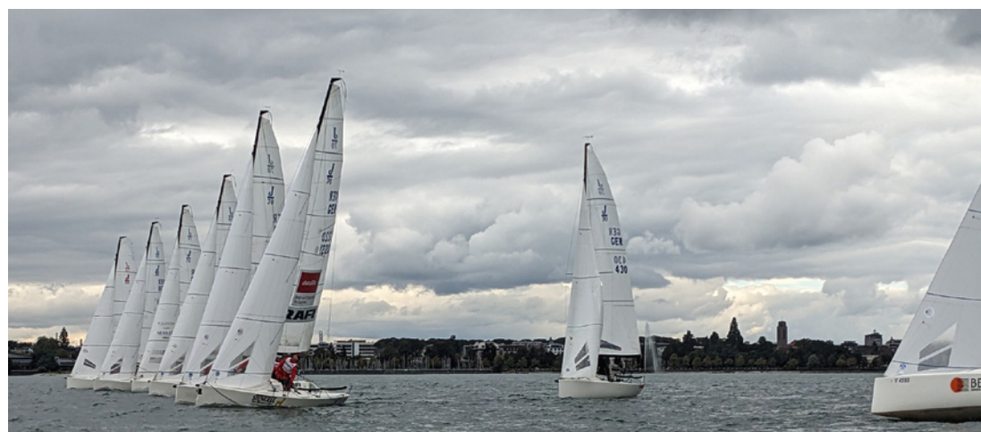
rechts: Flotter Wind blies bei der „Interboot-Trophy“ des WYC für Boote vom Typ J70.